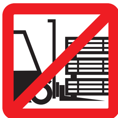
Nevykládat více balíků najednou