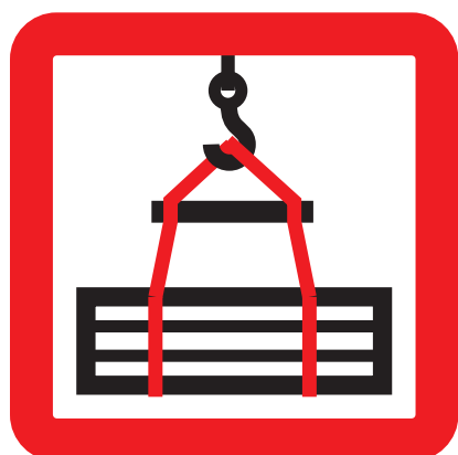
Správné uchycení pásů