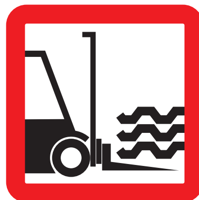
Vykládat vysokozdvíhým vozíkem