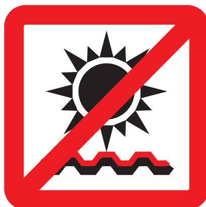
Neskladovat na slunci