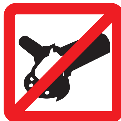
Nepoužívat úhlovou brusku