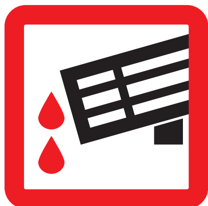
Při skladování vyspádovat pro odtékání vody