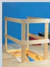
Horní ochranné zábradlí

Schody DOLLE mají vysokou technickou úroveň, jsou masivní a mimořádně odolné. Extra široké schodnice mají příčné vyřezování pro bezpečný výstup a sestup. K vyšší bezpečnosti lze nabídnout horní ochranné zábradlí, madla a plastové koncovky.